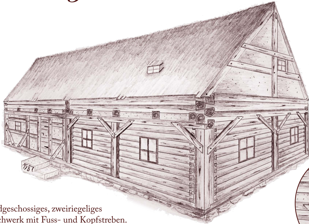
drempelartiger zweilagiger Blockkranz